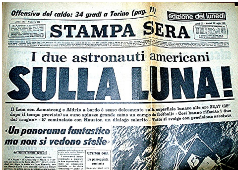
Fig. 3: Titolo di testa del 21 luglio 1969. Anche allora come oggi ci si lamentava del caldo anomalo.

E? stata una delle frasi icona del secolo scorso, ascoltata in diretta da mezzo mondo, grazie all?eccezionalità dell?evento: la prima volta, nella storia dell?umanità, un uomo camminava su un suolo che non apparteneva al pianeta Terra.