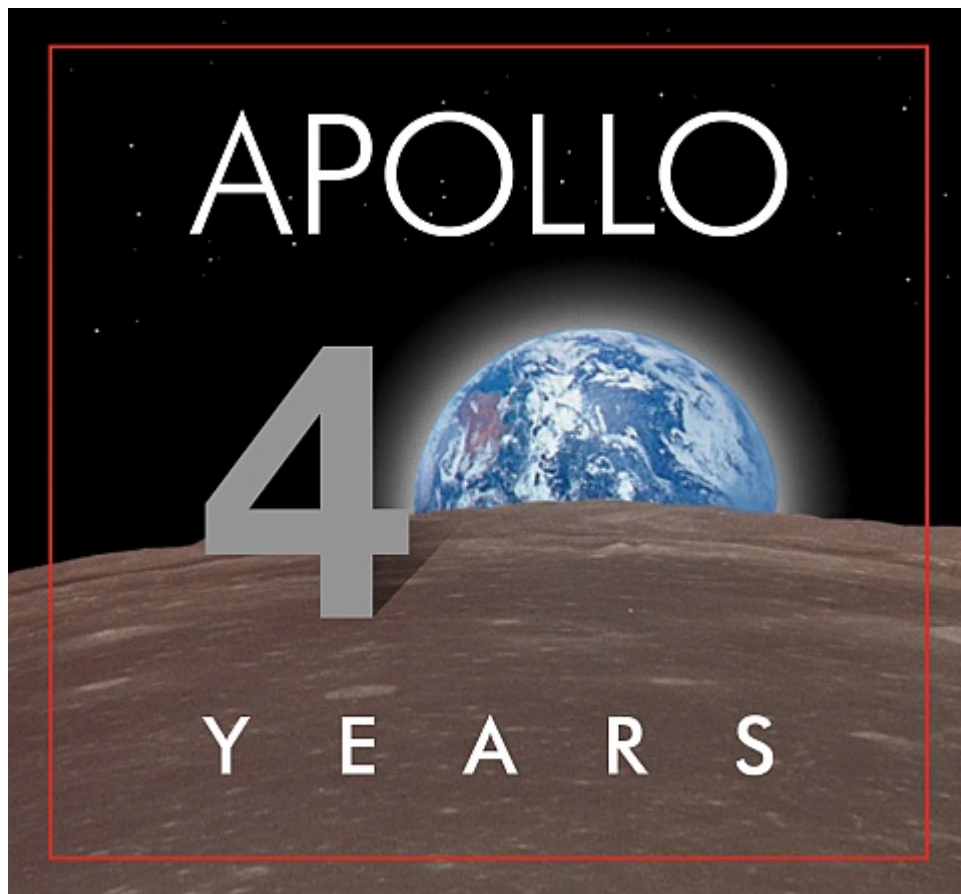
Fig. 4: Logo celebrazioni dei quarant'anni.

vicino alla Terra che conta una presenza stabile dell'uomo, da almeno vent'anni, solo sulla ISS (Stazione Spaziale Internazionale). Oggi l'interesse è cresciuto, la Cina sta esplorando con Rover e sonde l'altra faccia della Luna, l'India ed Israele si sono lanciate anche loro con ambiziosi progetti, anche se quello israeliano è naufragato nella parte finale, ma non è escluso un altro tentativo. L'interesse per lo spazio poi non è più solo coltivato dagli Stati nazionali, ma anche da imprese private che stanno attivamente contribuendo alle missioni spaziali, tanto da far progettare alla NASA per il 2024 Artemis il ritorno sulla Luna con una base permanente sia in orbita lunare che sulla stessa superficie, quale trampolino di lancio per le prime missioni umane su Marte, prova ne è anche il logo della celebrazione del cinquantenario del primo allunaggio che raffigura entrambi i corpi celesti (vedi Fig. 1), uniti da una linea che ricorda un lungo ponte che li unisce.