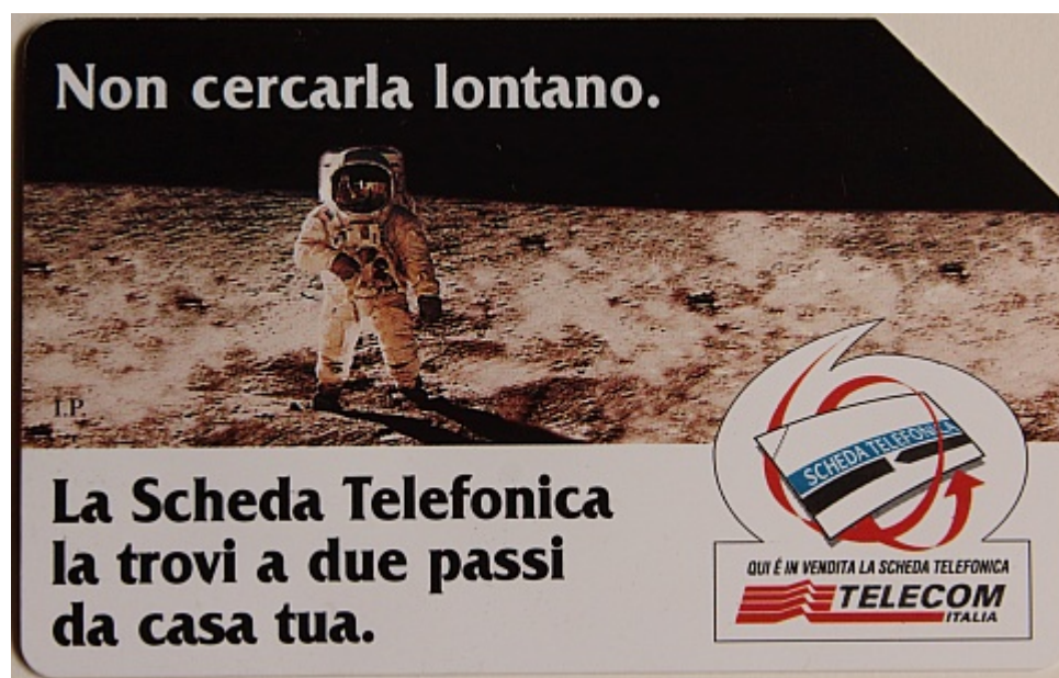
Fig. 6: Carta telefonica da L.5.000 emessa nel 1987 da Telecom scadenza 30.06.1999.