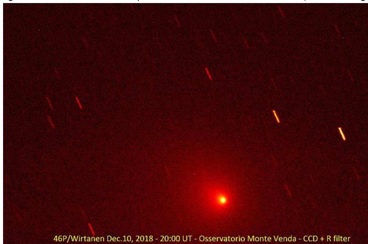
46P/Wirtanen Dec.10, 2018 - 20:00 UT - Osservatorio Monte Venda - CCD + R filter

fig.1 la cometa 46P/Wirtanen ripresa il 10 dicembre 2018 con filtro R (click to enlarge).